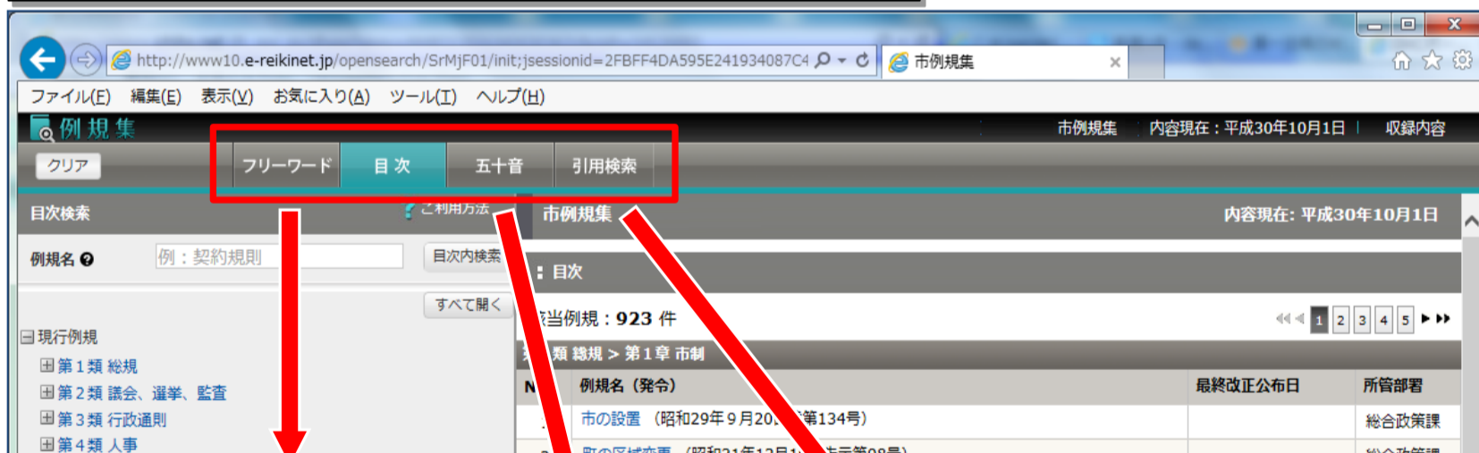
「フリーワード」画面

[1-2] 画面上部に表示されるボタン(「フリーワード」、「目次」、「五十音」、「引用検索」)をクリックすることで表示を切り替えることができます。